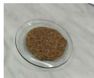
Fotografía 1 Pobre (sin efervescencia)