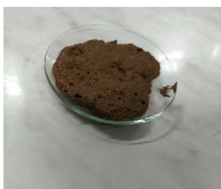
Obrázok 2 Stredný (mierne bublanie)