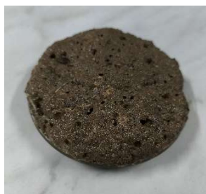
Obrázok 3 Vysoký (intenzívne šumenie a/alebo pena)